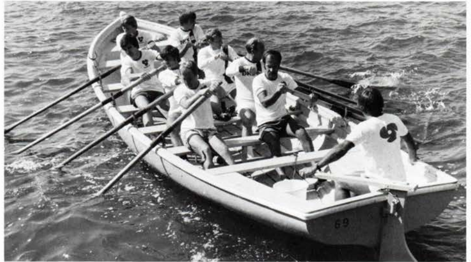
København. Travallie nr. 69 med ØK/ScanDutch roere.

De 9 ØK/ScanDutch roere trak ved lodtrækningen i år, ligesom sidste år, båd nr. 69, men sidste år var tiden for samme distance 6,12,0.