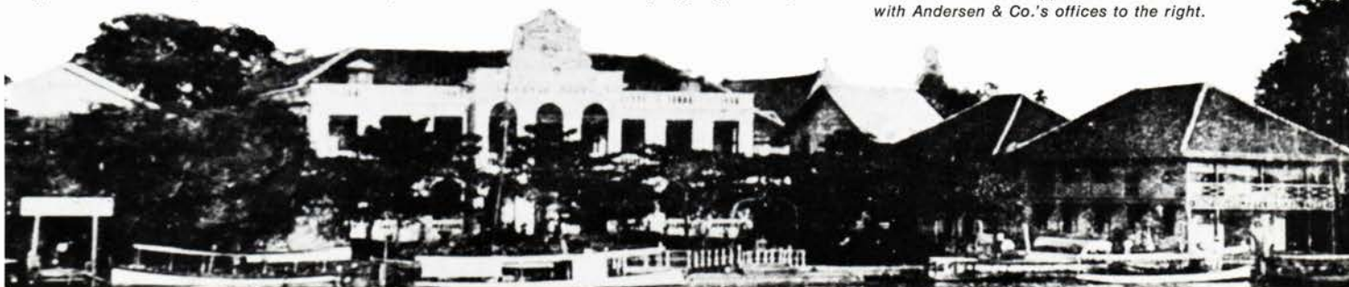
Oriental Hotel as it appeared in 1887 with Andersen & Co.'s offices to the right.