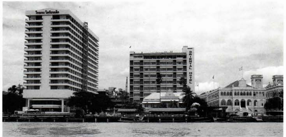
Bangkok. Midt for, det oprindelige Oriental Hotel med "Tower Wing" lige bag ved og "River Wing" til venstre. Til højre Bangkok filialens kontorbygning med Assumption Katedralens to tårne i baggrunden.

Træbygningen, som var opført i 1876, blev i 1887 erstattet med en bygning i sten i datidens elegante stil med luftige verandaer og gange. I 1893 blev hotel-let afhændet. Etatsråden havde i mel-lemtiden etableret sig på Oriental Ave-nue, der var anlagt af Andersen & Co.