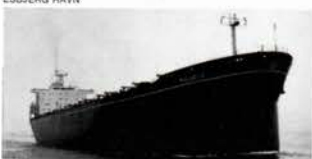
M/S MALACCA FRA B & W

VIGO CHARCUTERI A/S bringer har netop fuldført en udvidelse til 6,5 mill. kr. ALFRAGT A/S bringer gods-terminal for 6,7 mill. kr. i Esbjerg. Desuden har ØK bestilt 11 nye skibe til en samlet pris af 1350 mill. kr. ved danske værfter (B & W og Nakskov). Alle disse investeringer udtrykker tillid til fremtiden. Og de giver dansk industri, eksport og økonomi. De kommer ikke blot virksomhederne til gode. De sikrer samtidigt medarbejderne fortsat beskæftigelse. De styrker dansk erhvervsliv — og Danmark. Kompagniets netto-indtjening i fremmed valuta androg 2050 mill. kr. i 1974 og 1975.