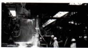
VARDE STAALVÆRK A/S

NAKSKOV SKIBSVÆRFT A/S effektiviseres for eksempel for 30 mill. kr. DANSK SOJAKAGEFABRIK A/S i København udvides og moderniseres for 60 mill. kr. VARDE STAALVÆRK A/S skal moderniseres og udvides for 12,8 mill. kr.