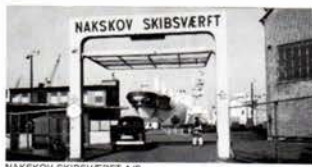
NAKSKOV SKIBSVÆRFT A/S

ØK-koncernen, der omfatter 260 virksomheder i mere end 40 lande, er også i Danmark en stor arbejdsplads. ØK beskæftiger 9558 i Danmark: 8209 på virksomheder i land og 1349 på Kompagniets 29 skibe, der alle sejler under Dannebrog. Og koncernen investerer til stadighed i danske virksomheder og dermed danske arbejdspladser — over hele landet.