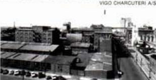
DANSK SOJAKAGEFABRIK A/S

VIGO CHARCUTERI A/S bringer har netop fuldført en udvidelse til 6,5 mill. kr. ALFRAGT A/S bringer gods-terminal for 6,7 mill. kr. i Esbjerg. Desuden har ØK bestilt 11 nye skibe til en samlet pris af 1350 mill. kr. ved danske værfter (B & W og Nakskov). Alle disse investeringer udtrykker tillid til fremtiden. Og de giver dansk industri, eksport og økonomi. De kommer ikke blot virksomhederne til gode. De sikrer samtidigt medarbejderne fortsat beskæftigelse. De styrker dansk erhvervsliv — og Danmark. Kompagniets netto-indtjening i fremmed valuta androg 2050 mill. kr. i 1974 og 1975.