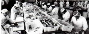
VIGO CHARCUTERI A/S