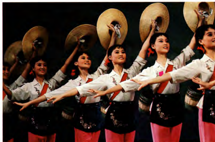
Yndige kinesiske danserinder var med til at underholde det danske regentpar og de fremtrædende kinesiske værter.

China's foremost artistes within the fields of song, music, and dance entertained the Queen and Prince Henrik in the Great Hall of the People in Beijing and were afterwards thanked by the Royal Couple here pictured on the stage together with some of the artistes.