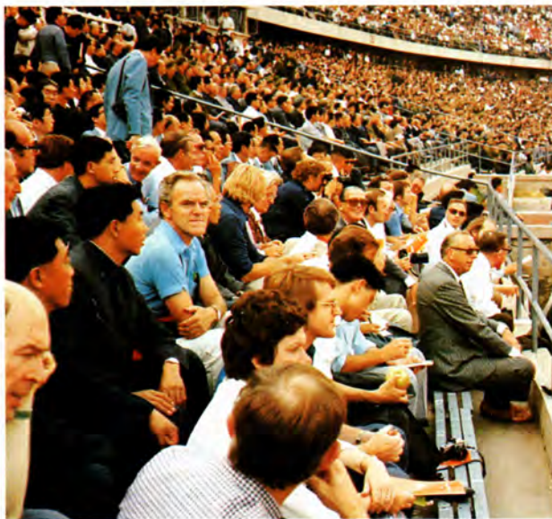
Regentparrets 89 danske ledsagere overværede også åbningen af de store idrætslege.

More than 10,000 athletes participated in the opening ceremony of the Chinese »Olympiad«, and with large coloured sheets 8,000 youngsters formed more than a score of impressive giant pictures on one of the long sides of the huge stadium.