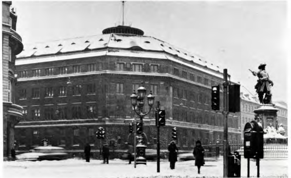
EAC's Head Office in "Winterfulll Copenhagen".

The Tourist Association of Copenhagen has created a new concept: "Win-