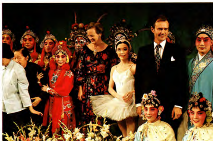
Kinas ypperste kunstnere inden for sang, musik og dans underholdt Dronning Margrethe og Prinsen i Folkets store Hal i Beijing, og blev efter forestillingen takket af regentparret, som herover ses sammen med kunstnerne på scenen.

The 89 Danes accompanying the Royal Couple also witnessed the opening ceremony of the National Games.