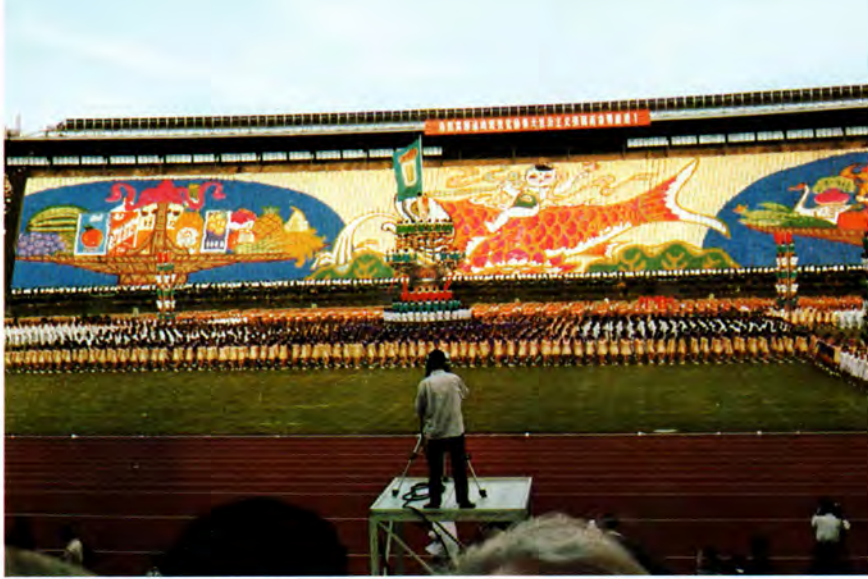
Over 10.000 idrætsfolk deltog i åbningen af den kinesiske »olympiade«, og 8000 dannede med store farveplader mere end en snes imponerende kæmpebilleder på det store stadions ene langside.

En historisk rejse på 30.000 km og 10 dage, der gennem de kinesiske massemedier satte Danmark på det kinesiske landkort og udbyggede venskabet og samarbejdet mellem de to lande – det lille, men stærkt industrialiserede kongedømme i Norden og den store folkerepublik i Østen, der med en tusindårig kultur som baggrund har indledt verdenshistoriens største moderniseringsproces.