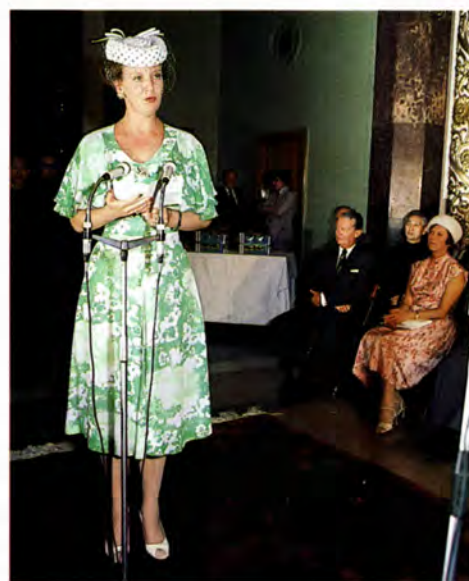
Dronning Margrethe erklærer H.C. Andersen-udstillingen i Beijings internationale udstillingscenter for åbnet.