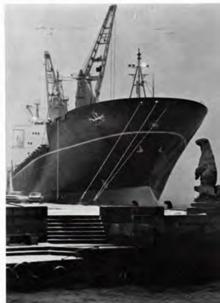
The "Langelinie" promenade's well-known Polar Bear sculpture pictured during winter in front of EAC's container vessel Boringia .

terfulll Copenhagen" which emits exactly the same incentives but with a wintery reflection. "Off season" drops out and is replaced by "Winterfulll season". These words embrace the warmth from the warm Gulf Stream, the lit-up streets, the cosy ("hyggelige") atmosphere in the glow of candlelights, the festive Christmas displays, and the theatre and ballet evenings which are distinct winter attractions – and the charm and hospitality remain the same.