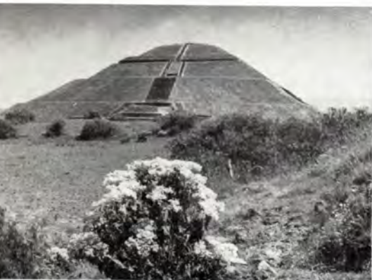
Mexico City. The sun pyramid in Teotihuacán, the old holy town of the Aztecs.

Mexicos økonomiske stabilitet og landets hurtige industrielle udvikling, er der ingen tvivl om, at Comercial Danesa har en god fremtid for sig her.