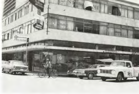
Mexico. Comercial Danesa's kontorbygning i Guadalajara. Mexico. The office building of Comercial Danesa at Guadalajara.