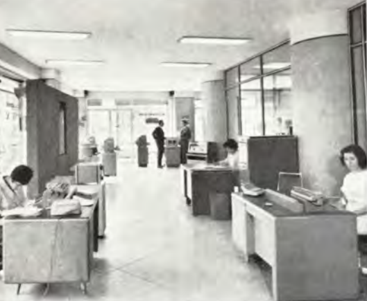
Mexico City. Comercial Danesa's udstillingslokaler med »Rex Rotary« og »Centrum« kontormaskiner.