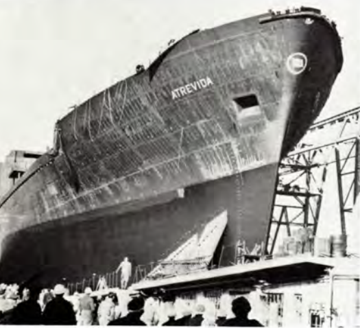
Nakskov. M/S »Atrevida« på vej ned ad beddingen på Nakskov Skibsværft. Nakskov. M/S »Atrevida« leaving the slipway at Nakskov Shipyard.

Atrevida er et lille forbjerg på sejlruten mellem Tahsis og Gold River.