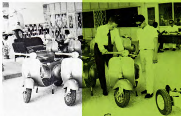
Demonstration af Vespa scooter hos Singapores motorafdeling.

Fra en meget beskednen begyndelse har Vespa-agenturet udviklet sig til at blive et af Malaya-organisationens gode aktiver. I 1961 blev der i Singapore, Malaya og Borneo solgt ialt 5.682 Vespa scootere inklusive vare-scootere, mod 75 enheder i anden halvdel af 1957, da vi begyndte vort pionerarbejde med at gøre Vespa scooteren kendt på dette marked. Vort gennemsnitlige månedlige salg i 1962 har været 410 enheder, hvilket er mere end 50 % af det totale salg af scootere.