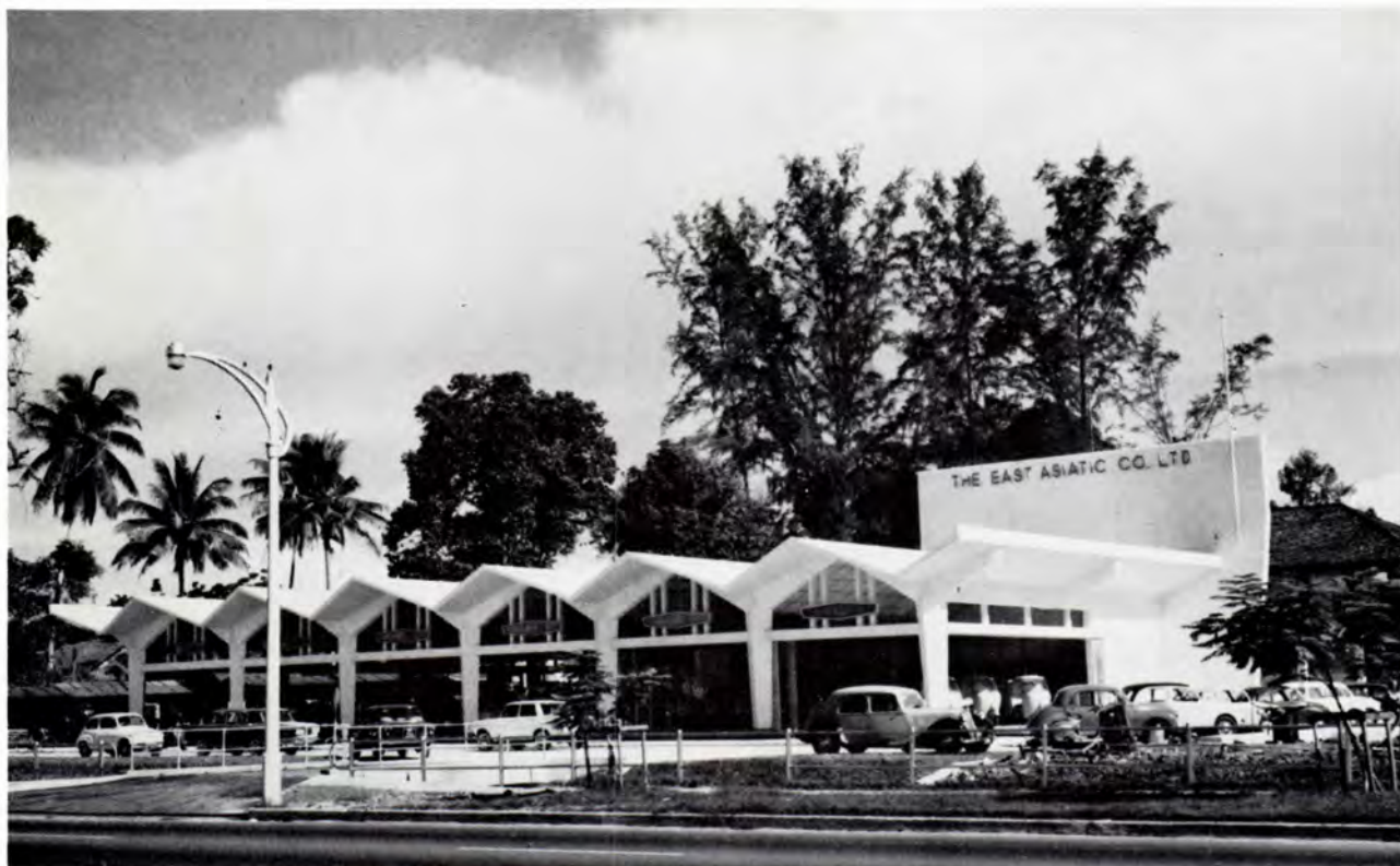
Singapore. Motorafdelingens nyopførte udstillingslokaler, kontorer og værksteder på Orchard Road.