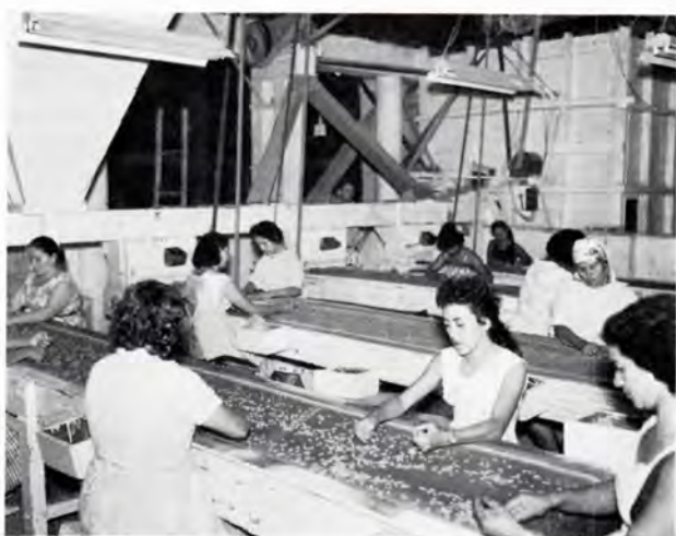
Kaffebønnerne finsorteres ved håndkraft.

The coffee trade is a most traditional one, but in case of any dispute about delivery where seller and buyer cannot reach an amicable settlement, the matter is appealed to the