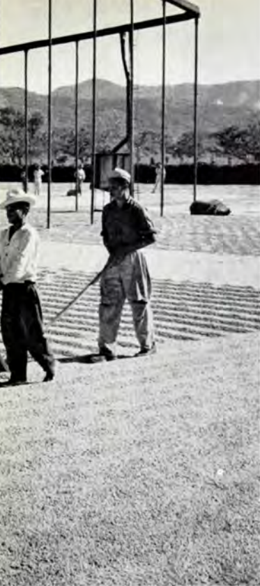
Kaffen spredes ud på tørrepladsen og soltorres.

After washing the coffee is spread out on the drying grounds exposed to the sun.