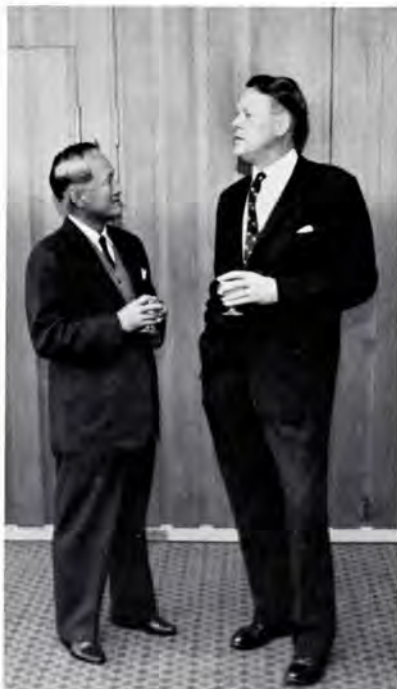
Den thailandske finansminister, The Hon. Sunthorn Hongladarom og statsminister J. O. Krag.

On September 28th, 1962 The Hon. Sunthorn Hongladarom, Minister of Finance for Thailand, arrived in Copenhagen on a visit to Denmark. The next day an official lunch was held at Christiansborg Castle, where Mr. A. C. Normann, the Danish Minister for Fisheries, acted as host in lieu of Mr. Per Hækkerup, the Danish Minister of Foreign Affairs, who at that time was participating in the meetings