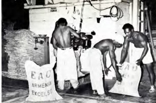
De færdige kaffebønner vejes.

The coffee beans, packed in gunny bags, being weighed.