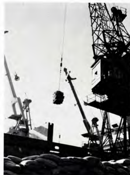
Kaffen lastes til eksport.