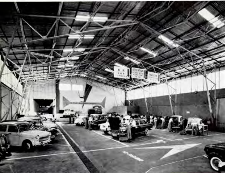
Penang kontorets store værksted.

An impressive view of the Motor Division, Penang