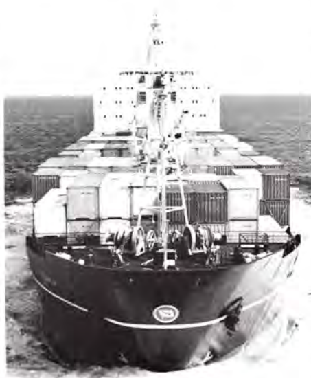
M.s. Samoa for fuld kraft i åbent vand.

Portland kl. 9 om morgenen, som det første af de indespærrede skibe, denne gravede rende uden vanskeligheder og nåede ud til Stillehavet med tre døgners forsinkelse. Gravearbejdet fortsattes, og i løbet af juli skulle renden være udvidet til 300 fods bredde og en dybde på 35 fod. Gravearbejdet fortsattes imidlertid, indtil en dybde på 40 fod er nået.