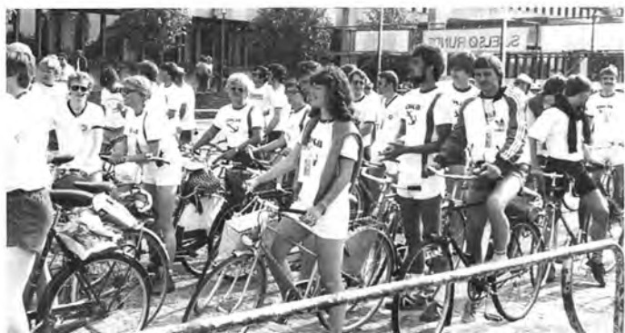
Et udsnit af vore mange deltagere i Sjælsø Rundt løbet umiddelbart før start.