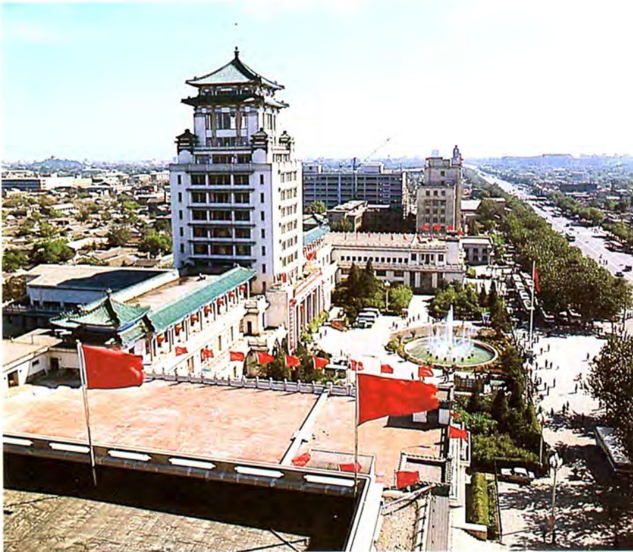
Minzu Wen Hua Gong i Beijing, hvor ØK som første udenlandske firma er rykket ind i nye kontorlokaler. Minzu Wen Hua Gong in Beijing into which EAC moved as the first foreign firm.

Kompagniet har også eget kontor i Shanghai. Det er indrettet i Peace Hotel, som ses herunder.