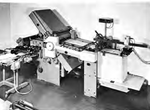
◀ STAHL-O-MAT K 66, en af de populæreste falsmaskiner i STAHL's produktionsprogram.

Despite efforts to enhance efficiency STAHL always has the welfare of its about 600 employees at heart, and many employees – particularly in the technical field – have consequently been with the company since its inception 31 years ago and thus contribute towards vouching for reliable and skilled workmanship in connection with construction of the machines.