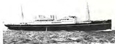
M.s. Amerika sænket 21. april 1943.

Artiklen blev i øvrigt gengivet i Juli-nummeret af »Søfart«, der udgives af Foreningen til Søfartens Fremme, med en udvidet skildring af den største enkeltkatastrofe for Kompagniets skibe under britisk flag; m.s. Amerika 's senkning i Danmarksstrædet.