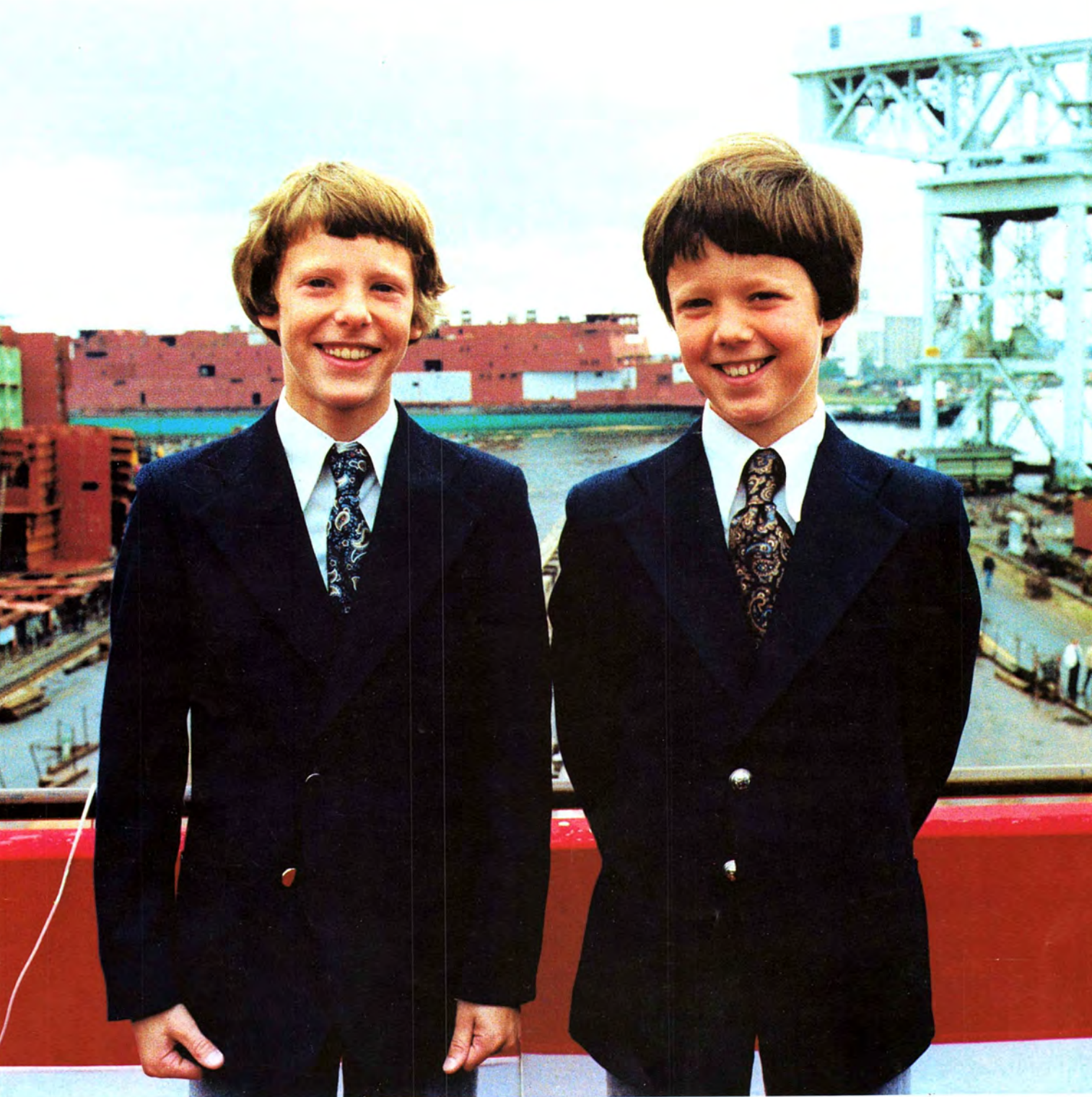
To Prinser af Danmark navngiver nybygninger i Nakskov Two Princes of Denmark christen newbuildings at Nakskov