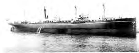
M.s. Siam sænket september 1942.