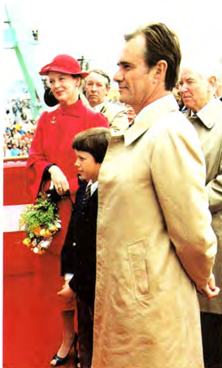
Regentparret og deres ældste søn betragter kærligt Prins Joachim, medens han navngiver nybygning nr. 223.

The Danish Royal Couple and their eldest son lovingly watching H.R.H. Prince Joachim perform the naming of newbuilding No. 223.