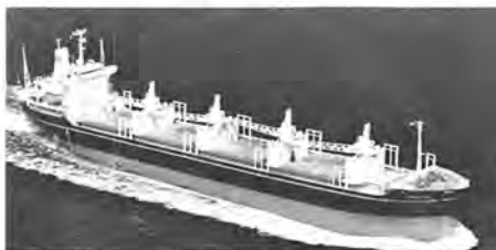
M.s. Casuarina .

Our Company has sold the 27,000-ton m.s. "Casuarina" – which was built in Japan in 1973 – to Lifegulf Compañia Naviera S.A., Panama. Delivery to the buyers is expected to take place during August whereafter the vessel will fly the Greek flag.