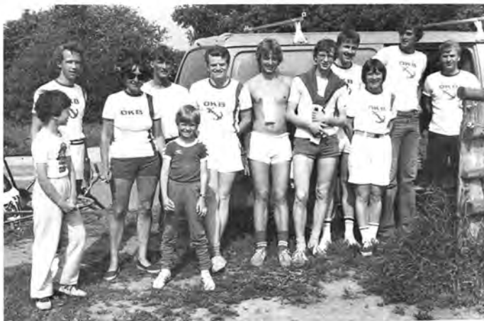
Deltagere i Sjælsø Rundt holder et velfortjent hvil ved vor forsyningsvogn.