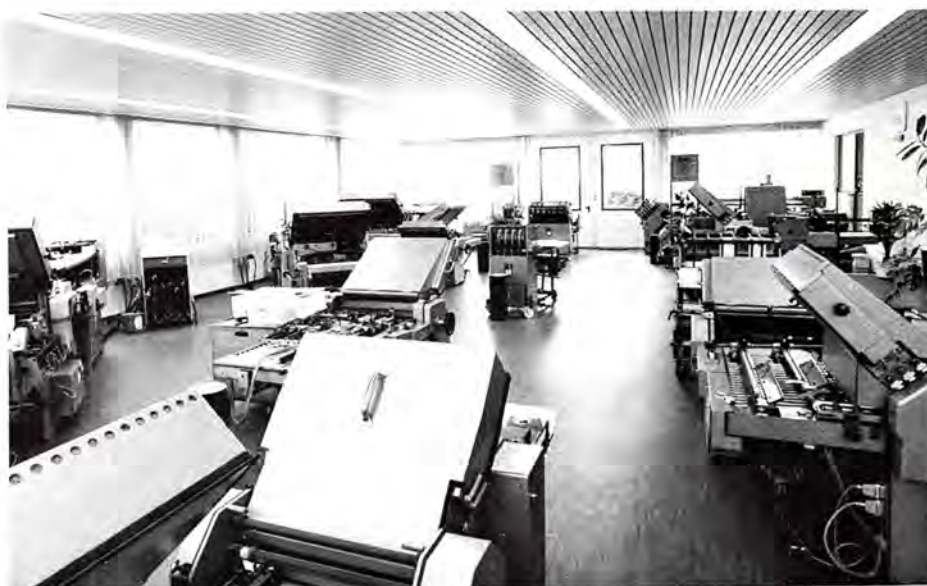
Udstillingshal i STAHL's informationscenter.

Trods bestræbelserne for øget effektivitet står hensynet til STAHL's ca. 600 medarbejdere dog altid i højsædet, og mange medarbejdere – især på det tekniske område – har da også været med fra begyndelsen for 31 år siden og er derved med til at borge for solidt og sagkyndigt arbejde i forbindelse med konstruktionen af maskinerne.