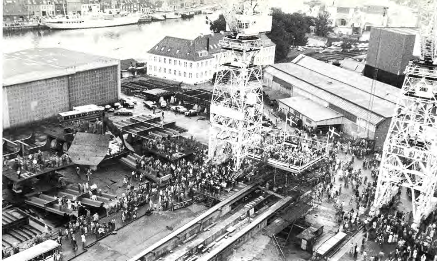
Den kongelige navngivning og søsætning på Nakskov Skibsværft. I baggrunden værftets administrationsbygning og Kongeskibet "Dannebrog".