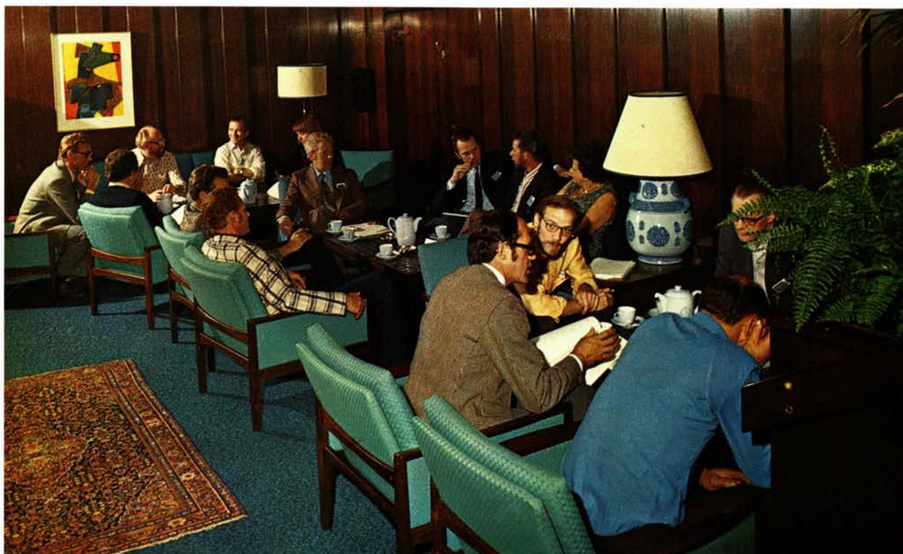
København. Gruppemøder under kurset.