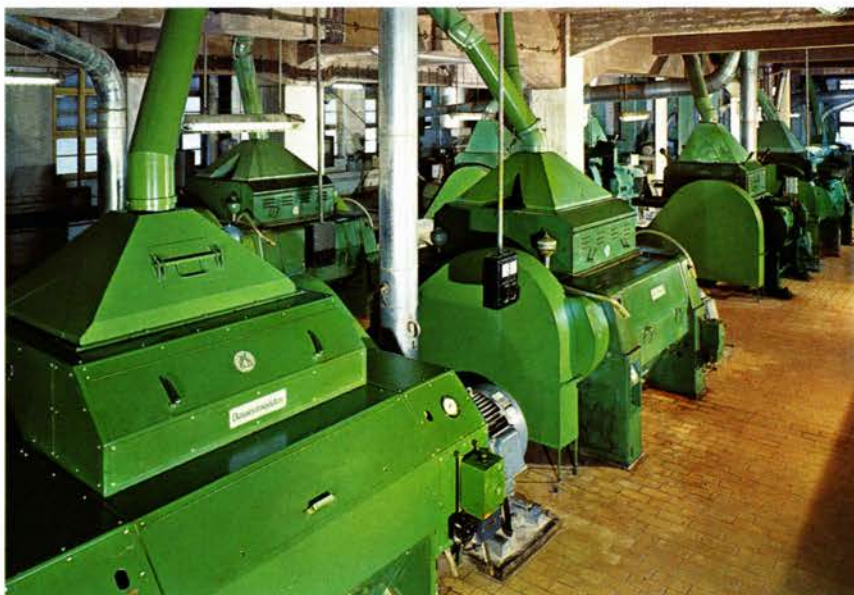
Hamburg. Valseværker til forbehandling af sojabønner inden ekstraktion. Hamburg. Roller Mills for pre-treatment of soya beans before extraction.

rer også gode muligheder for anvendelse af lastbiler i forbindelse med udlevering.