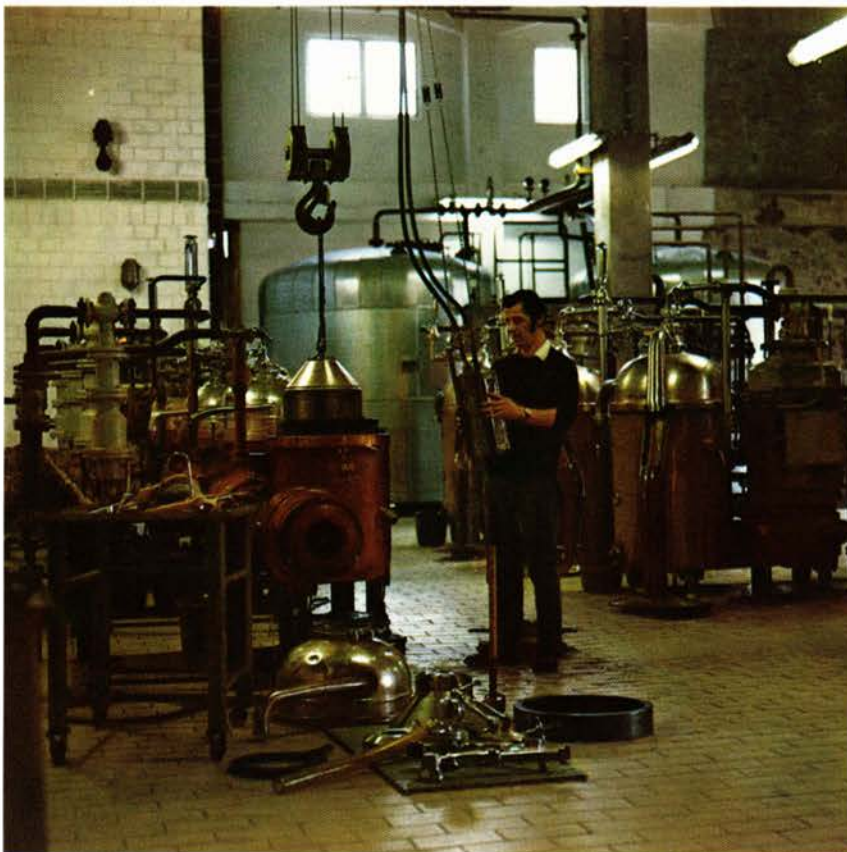
Hamburg. Centrifugal separators for degumming of soya oil.