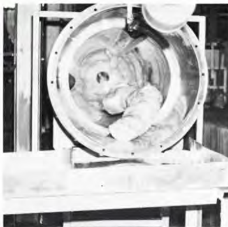
Gummi»pølsen« kommer ud af koagulatoren The rubber "sausage" coming out of the coagulator

Latexen bliver fra disse tanke ført til en kontinuerlig koagulator, hvor den blandes med fortyndet syre. Koagula-