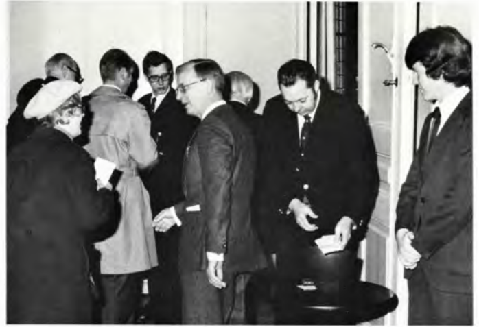
Aktionæerne ankommer til generalforsamlingen i Odd Fellow-Palæet.