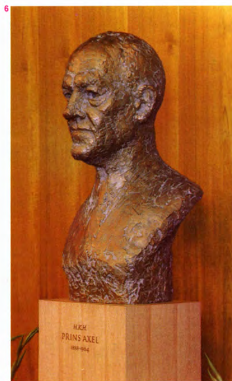
6. Knud Nellemoses bronzebuste af H.K.H. Prins Axel.