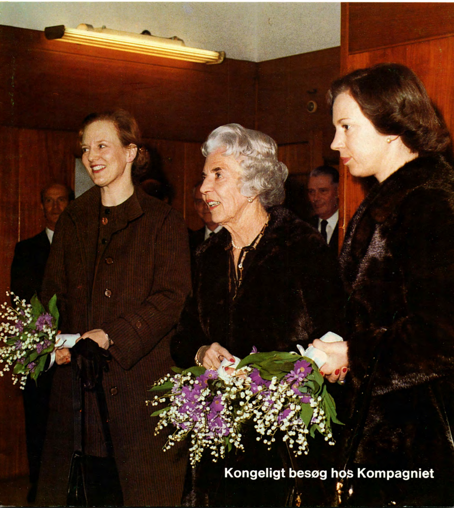
Kongeligt besøg hos Kompagniet