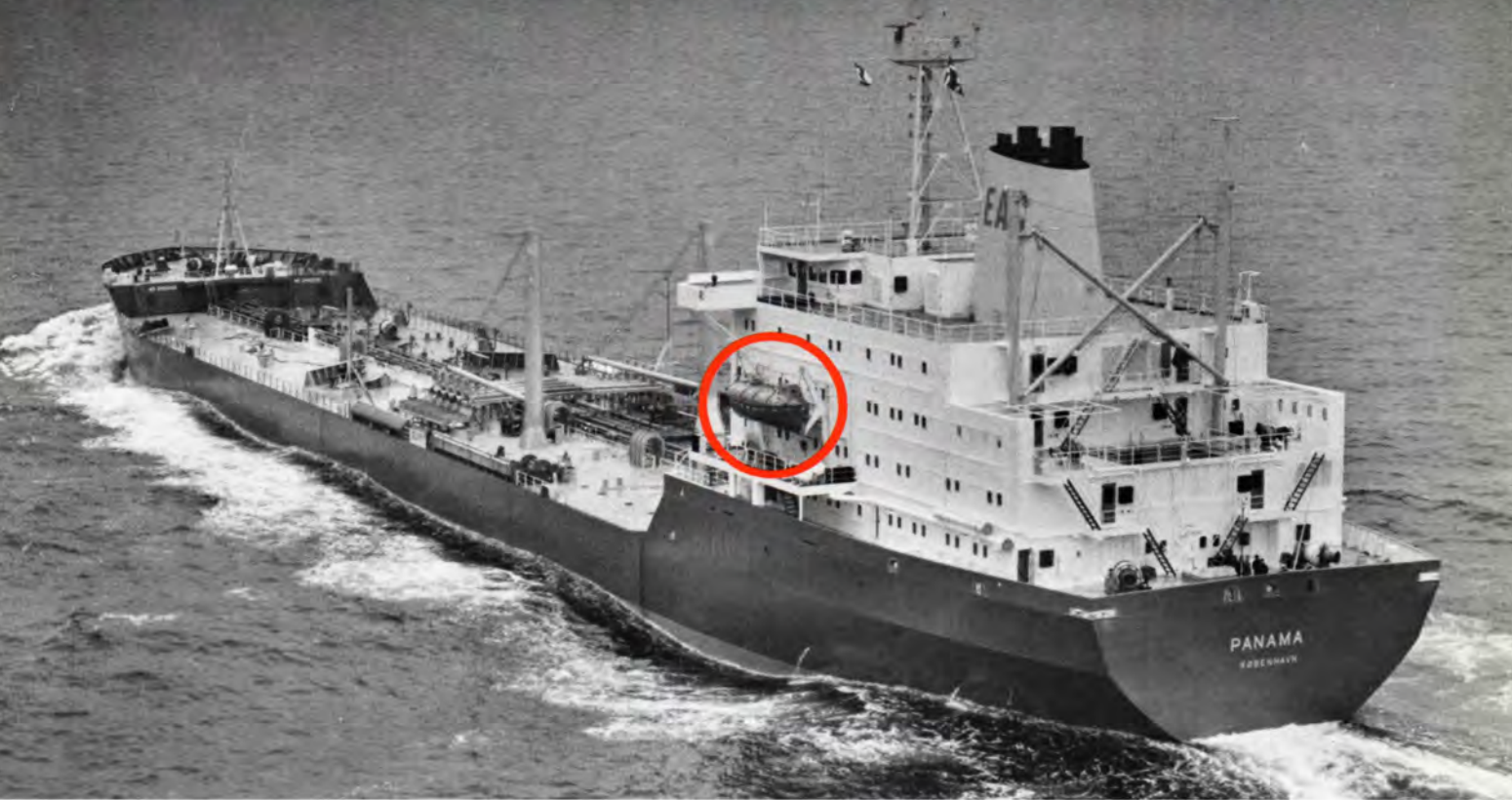
M.t. Panama fotograferet under prøveturen i Kattegat. I cirklen ses redningsbåden til 190.000 kr.