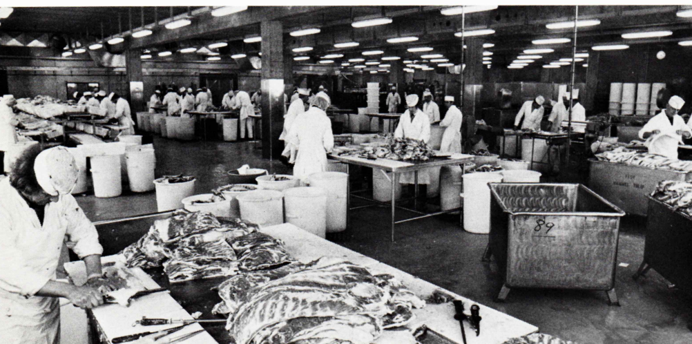
Ebeltoft. Udsnit af den nye opskæringsafdeling. Ebeltoft. A section of the new Carving Department.

Terminal-byggeriet, der betyder en total investering på 6,7 mill. kroner, påbegyndes så hurtigt, at det største pakhuse ventes færdigt snarest efter 1. oktober. Det mindre pakhuse og en kontorbygning opføres derefter, når den endelige placering af disse bygninger er helt fastlagt, og behovet for en udvidelse påvist.