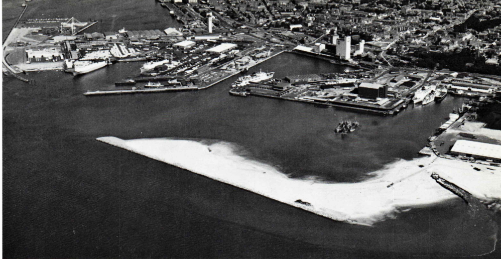
Luffoto af Esbjerg Havn, med den nye Europakaj i forgrunden.

One of the warehouses, called the Timber Store, will cover an area of 4,180 m 2 and