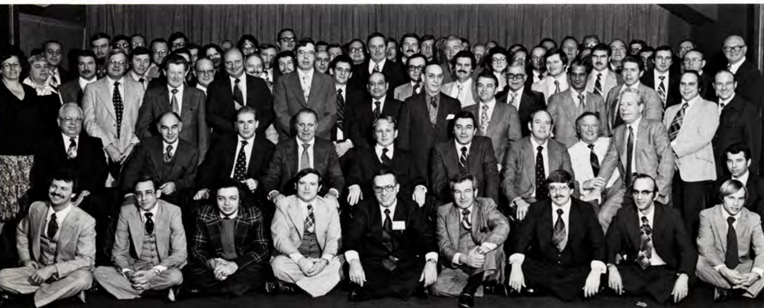
Participants at Heidelberg Eastern's annual sales meeting 1978.