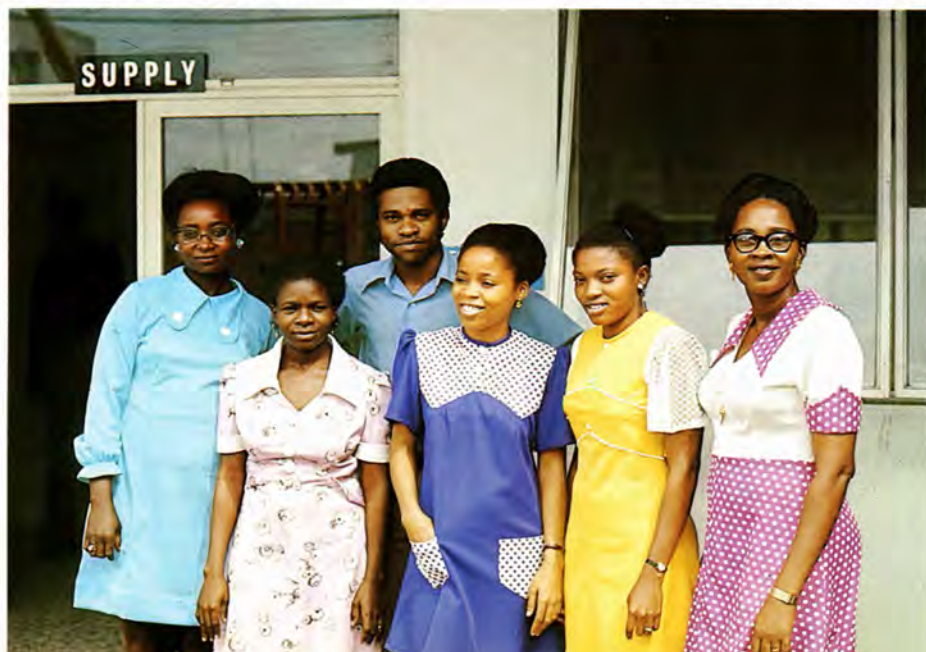
Briscoe's first six EDP operators.