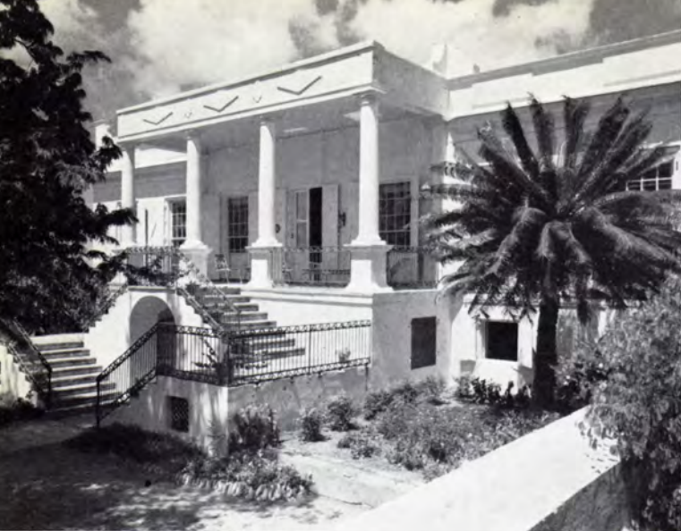
St. Thomas. Filialbestyrerens bolig »Denmark Hill«.