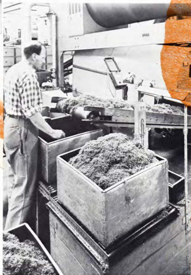
Skåret og tørret tobak afvejes i kasser til cigaretmaskinerne.

tacco-floors«, i modsætning til i Rhodesia, der først har påbegyndt dyrkningen af tobak omkring 1920. Her har man kunnet anlægge salget efter større linier, hvorfor handelen er koncentreret i Salisbury, og her findes i dag verdens tre største »tobacco-floors«. På hvert »floor« kan der oplægges ca. 6.000 baller. 3.000 sælges dagligt, og medens dette foregår, oplægges de andre 3.000, så de er klar til næste dags salg. Ballerne