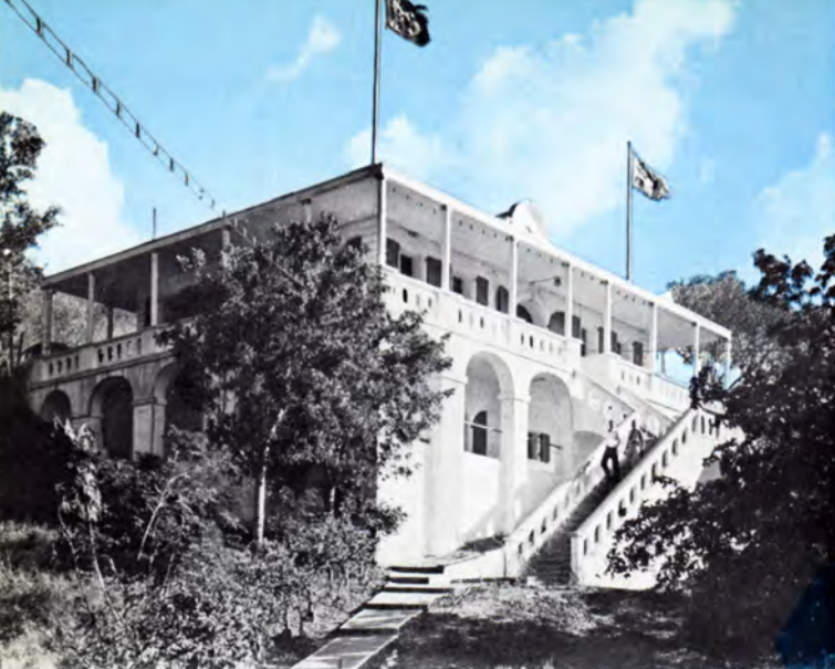
St. Thomas. Det Vestindiske Kompagnis kontor. St. Thomas. The office of The West Indian Co. Ltd.