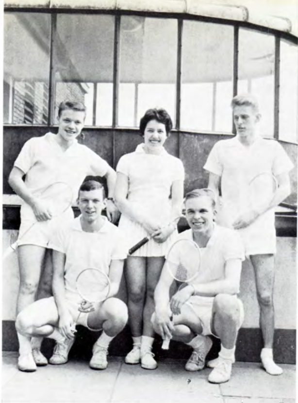
Vinderne af KFIU-unionsmesterskabet i badminton for sæsonen 1960-1961. Det er iøvrigt det 3. mesterskab i træk.

Winners of the KFIU union-championship 1960-1961. It is the third time in succession that an E. A. C.-team wins the championship.