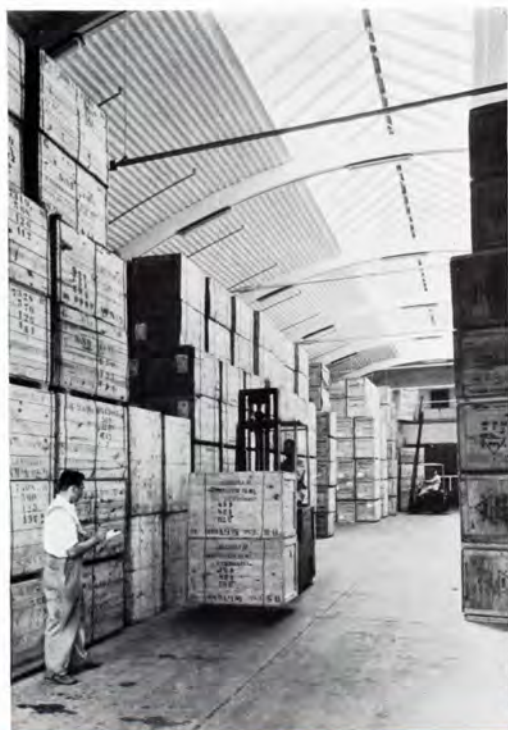
Råtabakslager med en kapacitet på omkring 3 mill. kg.

Tidligere var produktionen fordelt på flere forskellige tobaksfabrikker, men i dag er den koncentreret i to store fabrikker, der har specialiseret sig i cigaretfremstilling, og en tendens i denne retning gør sig nu gældende i de fleste lande. Årsagen hertil er, at det i dag er forbundet med meget store omkostninger at lancere et nyt cigaretmærke. Et amerikansk cigaretfirma, der ønskede at indføre et nyt mærke på markedet, offentliggjorde for kort tid siden, at dets annoncebudget dertil ville beløbe sig til 4 mill. dollars, og hvis man så dertil lægger omkostningerne til råtabak og emballage, kan man regne med det dobbelte beløb. Selvfølgelig vil fabrikanterne ikke oplyse, hvor meget det koster, men her i Danmark skal det nok ligge mellem 3–4 mill. kroner. Ingen kan på forhånd sige, om det ny