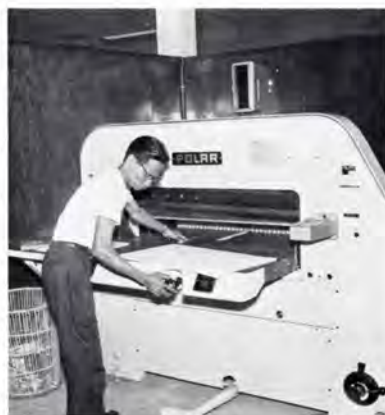
UNIPRINT, Bangkok. Bogbinderiet er bl. a. udstyret med en moderne tysk »POLAR«-skæremaskine.

The opening ceremony was performed on 14th May by H. E. The minister of Economic Affairs, Mr. Kasem Sriphayak, with a chapter of priests in attendance.