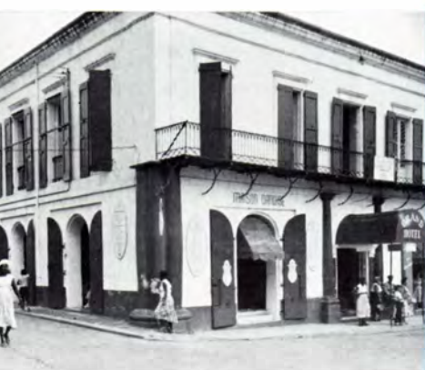
Charlotte Amalie. »Maison Danoise», Nørregade.