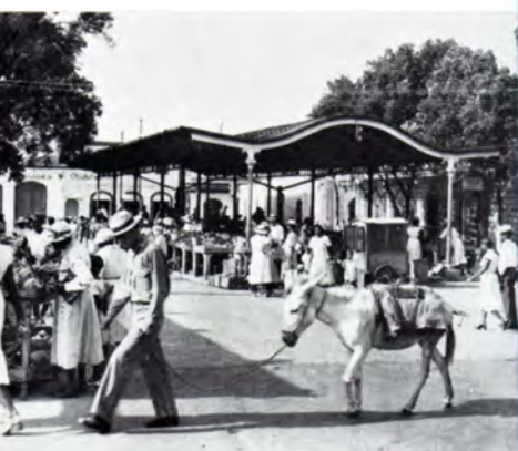
Charlotte Amalie. Det gamle marked. — The Old Market.

handel er der oprettet mange forretninger, der sælger varer fra Europa, Mexico, Indien, Thailand, Hongkong, Japan etc.