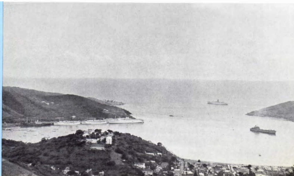
St. Thomas. View of the harbour. Three big tourist vessels are moored alongside the Company's quay.