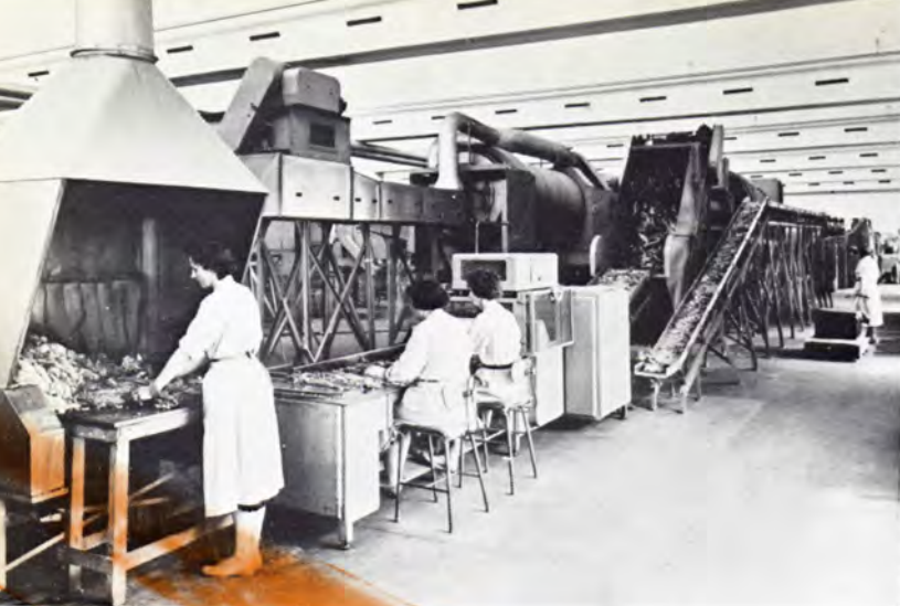
Fugtning af råtabak inden stilkene fjernes automatisk.

Humidifying of raw tobacco before the leaf is «stemmed», i. e., the thick woody midrib is removed.