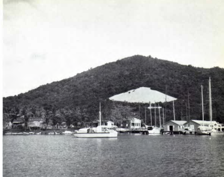
St. Thomas. Lystbådehavnen. Det lyse parti i baggrunden er Kompagniets »water catchment» til opsamlng af regnvand.

De amerikanske turister kan medbringe varer til et vist beløb toldfrit til U. S. A., og med henblik på denne