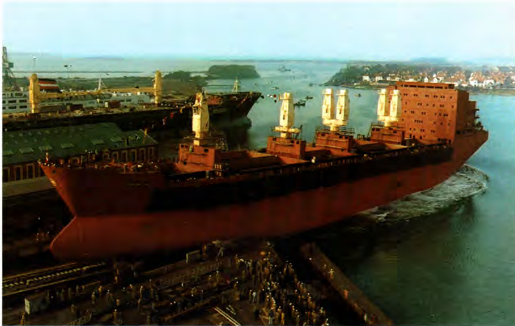
M.s. Samoa glider ud i sit rette element.