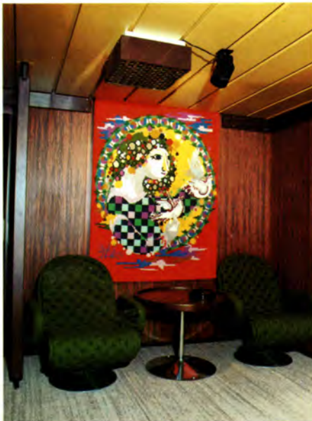
Siddegruppe ved Bjørn Wiinblads gobelin »Right hand«. A Cosy corner in front of Bjørn Wiinblads tapestry "Right hand".

Apteringen kan i øvrigt betegnes som meget miljøvenlig. Ved opbygning af skodder er anvendt Rockwool-elementer, beklædt med vinylfolie, og til lofter er anvendt Dæmpa. Disse materialer imødekommer både brand- og lydæssige krav. Ved valg af farver er der lagt vægt på lyse og varme toner.