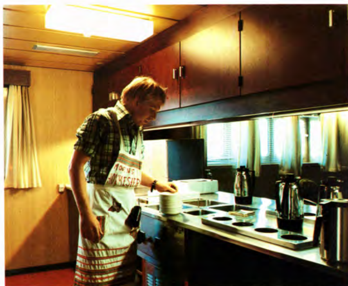
Pantry ved spisesalon.

The general impression is both friendly and inviting, aimed at homeliness.