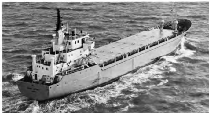
M.s. Baltic Osprey .

På vejen til og fra Gibraltar anløbes bl. a. Lissabon, og MacAndrews & Co. Ltd. genopliver hermed rederiets traditionelle rutefart på Lissabon, der går over 150 år tilbage. På vejen tilbage til Storbritannien anløbes i øvrigt også de spanske havne Cartagena og Cadiz.