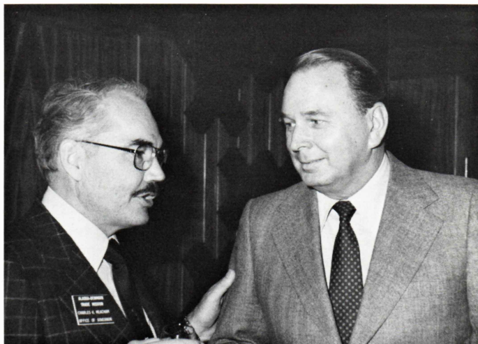
Fra besøget på Hovedkontoret:

The delegation attended a luncheon at Head Office during the stay in Denmark.