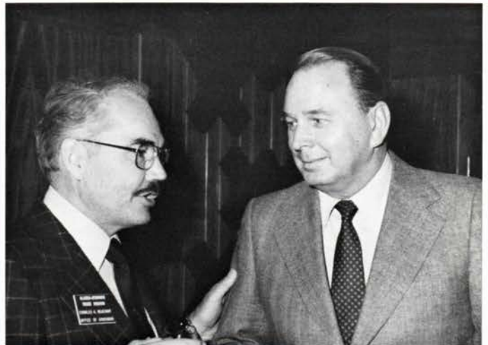
Fra besøget på Hovedkontoret:

The delegation attended a luncheon at Head Office during the stay in Denmark.