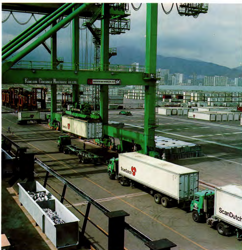
Hong Kong. ScanDutch containere i Kowloon's container terminal i Kwai Chung.