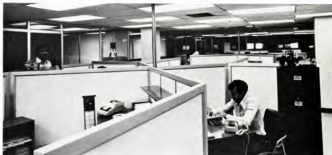
Ved ombygningen er der indrettet kontorlokaler, der udgør en blanding af individuelle kontorer og kontorlandskab.

OMS betjener kunderne med 19 servicevogne, og kunderne besøges regelmæssigt af instruktører fra OMS og fra de udenlandske leverandører med John Deere i spidsen. Til serviceskolerne er knyttet to faste instruktører, og de har såvel uddannelsesværksteder som moderne, audio-visuelt materiel til deres rådighed – alt sammen med det formål at sikre medarbejderne en god uddannelse og kunderne en første classes betjening før, under og efter maskinindkøbene.