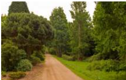
Aboretet i Hørsholm