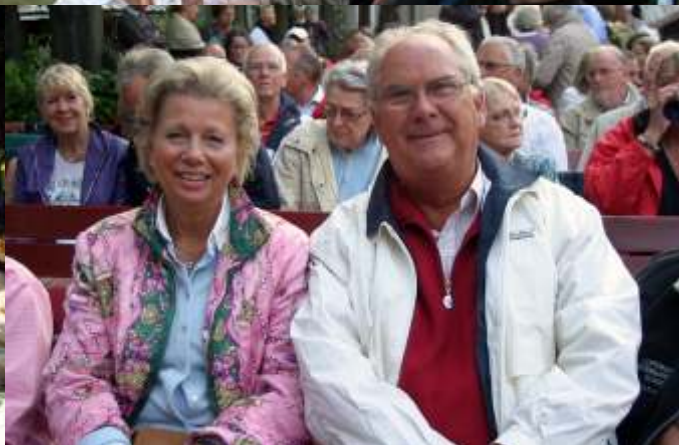
n og Tor derefter klar til at se Don Juan.