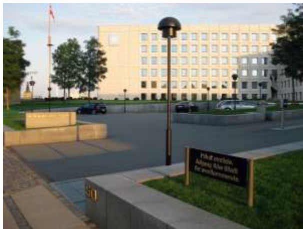
A.P. Møller-Mærsk's hovedsæde på Esplanaden

Klubben har arrangeret besøg hos A.P. Møller-Mærsk A/S torsdag 14. oktober kl. 11, hvor vi bl.a. vil se A.P. Møller-Mærsk Museum. Deltagelsen er gratis, men tilmelding (som ovenfor) er nødvendig, da holdets størrelse er begrænset. Vi mødes ved receptionen i A.P. Møller-Mærsk's hovedsæde på Esplanaden 50. Efter besøget er det muligt at arrangere frokost på frivillig basis og for egen regning i nærliggende restaurant, så vi hører gerne fra deltagerne ved tilmelding, om dette har deres interesse.