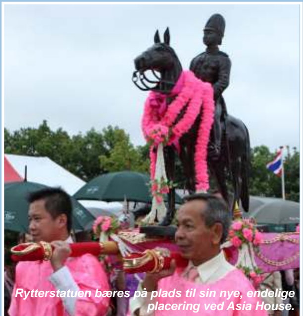
Rytterstatuen bæres på plads til sin nye, endelige placering ved Asia House.

Den thailandske konge besøgte Danmark i 1897 og 1907. I forbindelse med det andet besøg lagde kongen vejen forbi bl.a. ØK's daværende hovedsæde i Frihavnen (fra 1997: Asia House), Frijsenborg og Skagen. Ved besøget på Skagen afleverede kongen som gave et meget stort royalt flag (lyserødt med en stor hvid elefant i midten). Det var anledning til en række tiltag for at etablere en udstilling på Skagen Forsættes på side 5