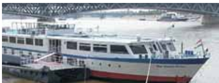
Der Kleine Prinz

John Busch har været ude på en ny, spændende udlandsrejse for - til brug for forskellige rejsebureauer - at filme et krydstogt i form af flodsejlads fra Donaudeltaet ved Sortehavet til Wien med det gode skib "Der Kleine Prinz".