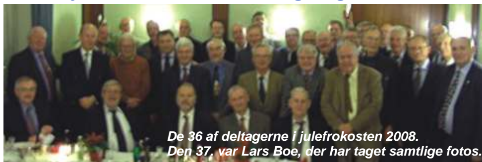
De 36 af deltagerne i julefrokosten 2008. Den 37. var Lars Boe, der har taget samtlige fotos.