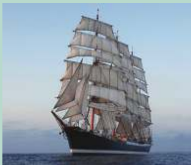
Sedov på vej mod Madeira