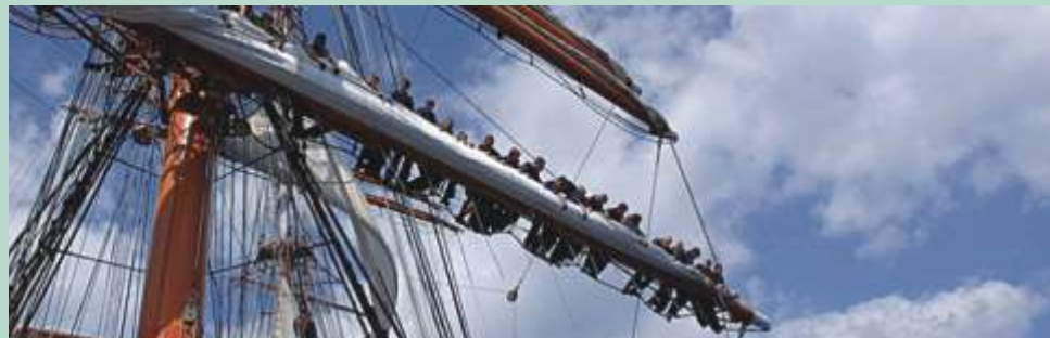
Besætningsmedlemmer på arbejde i masterne

Han tilføjer, at alle de gennemførte optagelser er foregået planmæssigt og uden uheld af nogen art. I de kommende tre måneder suppleres de med yderligere 20 timers film, hvorefter man tager fat på det store arbejde med at redigere og færdiggøre filmen, hvis premiere og forevisning på tv allerede drøftes med Danmarks Radio. E.E.