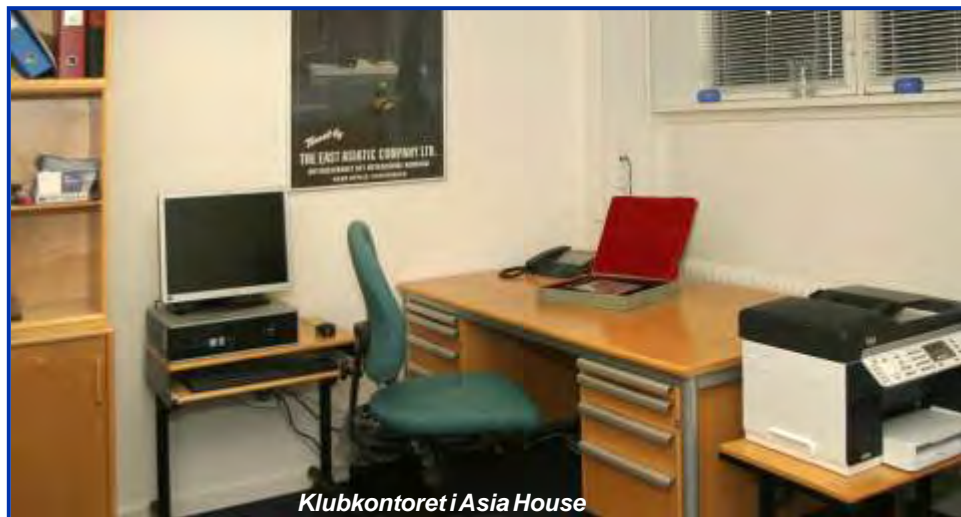
Klubkontoret i Asia House