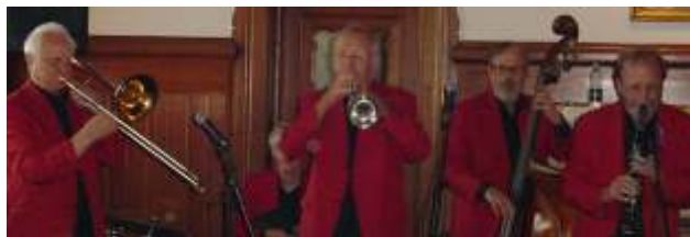
Ricardos spillede, så taget næsten lettede

Deltagerne i generalforsamlingen sammen med nyankomne ventede spændt på næste arrangement, nemlig aftenens jazz ved Ricardos Jazzmen.