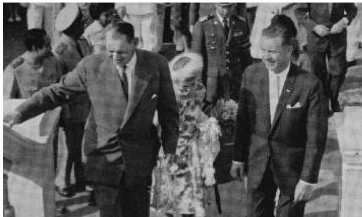
Kongeparrets besøg i ØK's Bangkok hovedsæde vakte stor lokal opsig.

12. januar ankommer kong Frederik og dronning Ingrid til Bangkok på fem dages officielt besøg. 15. januar