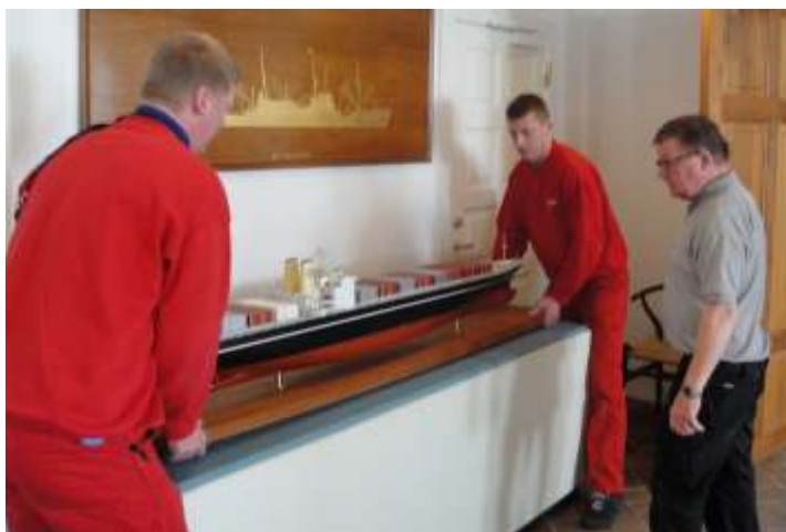
Her ankommer modellen af SELANDIA III til Asia House, hvor den skal være med til at fuldende den historiske ramme for det navnkundige skibsnavn i Asia House.

En model af SELANDIA III har i samarbejde med Søfartsmuseet i Helsingør sat kurs mod Indiakaj. Modellen indgår nu i markeringen af dette navnkundige skibsnavn i ØK's historie i det renoverede Selandia- rum i Asia House's underetage sammen med I- og II versionerne af SELANDIA.